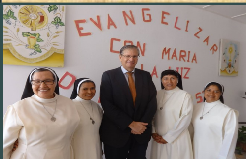
Agradecemos la presencia de nuestros ilustres visitantes.

El sábado 21 de noviembre con motivo de la visita a la Provincia de Cabo Delgado por parte de la Agencia Española de Cooperación Internacional para el desarrollo, el Embajador de España y la Coordinadora General de Cooperación a la Provincia de Cabo Delgado, realizaron una visita especial a nuestra comunidad de Pemba, con el fin de conocer la labor que efectúan nuestras hermanas, escuchar sus inquietudes y las necesidades del lugar, así como apreciar las instalaciones en las que realizan sus actividades.